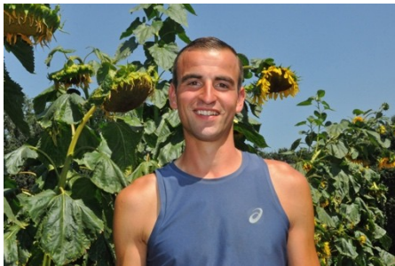
(De winnaar. Foto: Dick Buskermolen)

Hoe dat is afgelopen kun je lezen op natuurenmilieuheusden.nl .