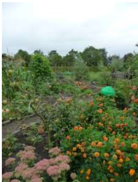
(foto: ecologische tuin, voorbeeld uit part.coll.)